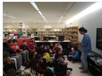
Visita á Biblioteca do Castrillón

problemas co escenario do salón de actos pero os actores fixéronno moi ben e todos rimos un cacho.