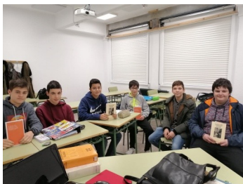
Club de lectura 3º ESO