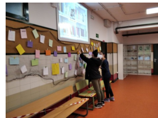
Literatura na rede

Os alumnos participaron na charla facéndolle preguntas á escritora sobre a obra lida. Non descartamos novos encontros en streaming